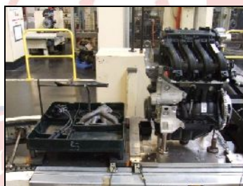
Fig. 1.1 Exemplu de kit pentru produsul motor (Times New Roman 11 ppt)